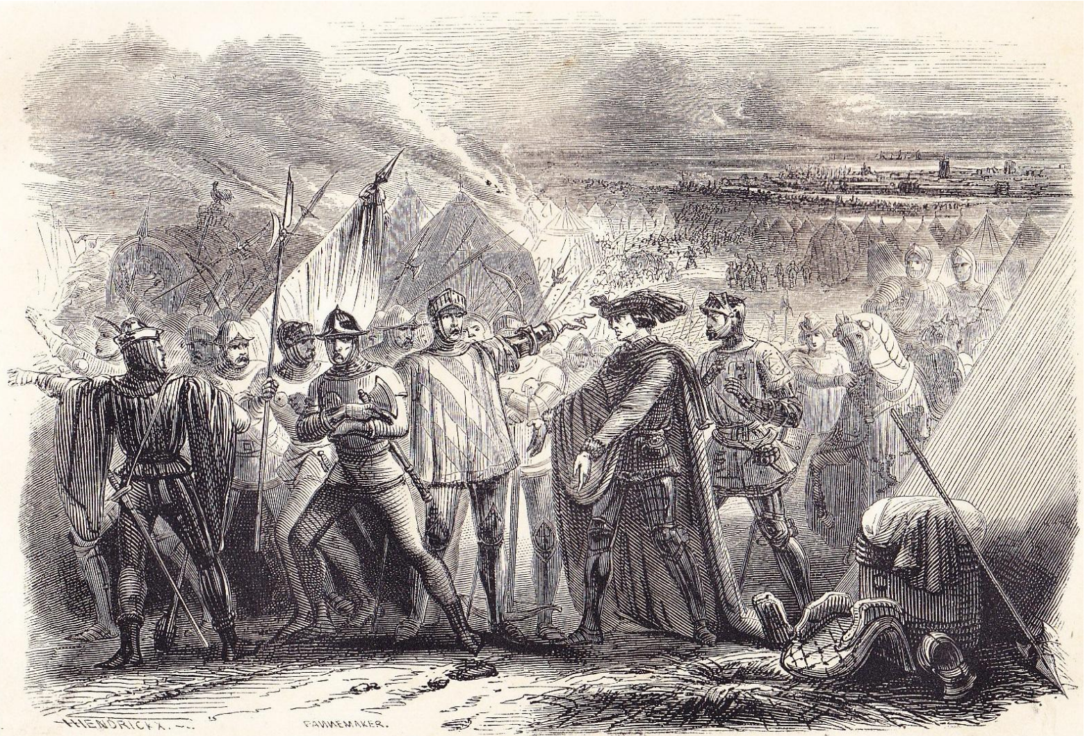
Les Bretons abandonnant le duc de Bretagne au siège de Vannes.